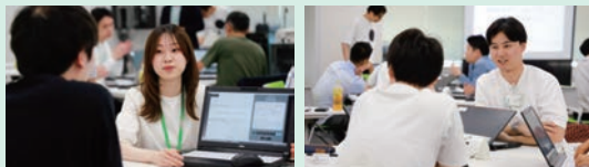
マイパーパスワークショップの様子