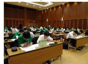
（「エコノミクス甲子園大阪大会」の様子）