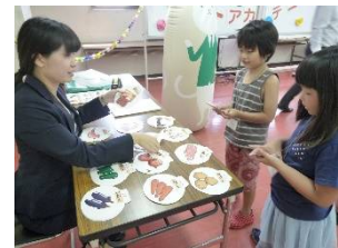
（昨年の開催の様子）

今年度は昨年32会場から38会場に開催規模を拡大。関西一円の地域の子どもたちの金融知識向上を応援します。