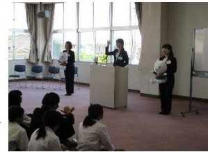
（「マナー講座」の様子）

2018年度は31校から受け入れを実施。従業員が考えた様々なプログラムを通じて、地域とのかかわりや自分の進路について考える機会を提供しています。