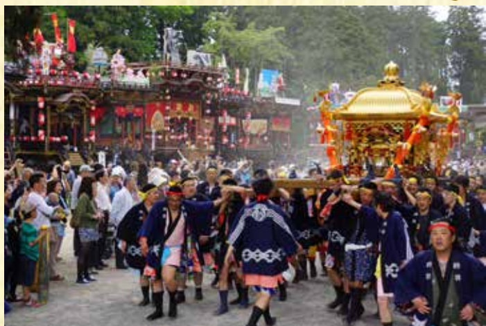
日野祭 (宵祭 5月2日 本祭 5月3日) 滋賀県指定無形民俗文化財