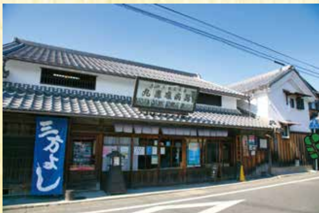
日野まちかど感応館 旧正野玄三薬店 (日野観光協会) 国登録有形文化財

日時 令和4年 11月14日(月) 14時～ 会場 埼玉県さいたま市浦和コミュニティセンター さいたま市浦和区東高砂町11-1 コムナーレ 10階(浦和駅東口側) 対象 日野町にゆかり、または興味がある方で したら、どなたでも参加いただけます