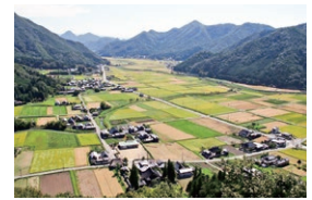
三田の魅力である自然・里山・農村を守り活用するまち