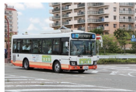
誰もが移動に困らないように整備されたまち