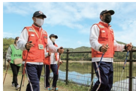
誰もが楽しみながらいつまでも健康に暮らす