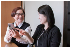
高齢者や障害者等が安心して暮らせるように支える