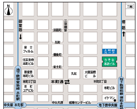
○最寄りの駅/地下鉄堺筋線・中央線 堺筋本町駅(出口①) 地下鉄御堂筋線 本町駅(出口③)