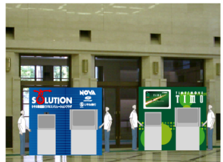
■TIMO・りそな御堂筋ビジネスソリューションプラザブース