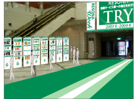
■12枚のパネルに各施策をパネル化