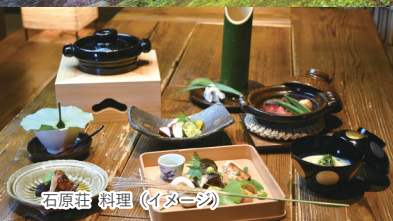
石原荘 料理 (イメージ)