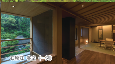
石原荘 客室 (一例)