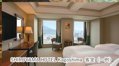
SHIROYAMA HOTEL Kagoshima 客室 (一例)