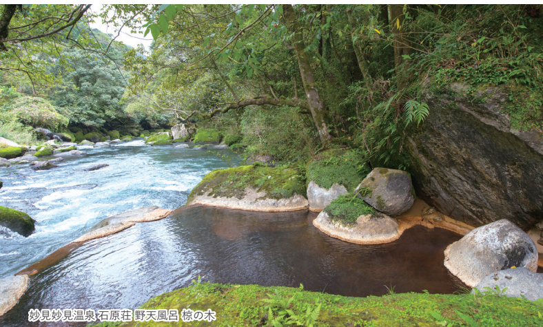
妙見妙見温泉石原荘 野天風呂 椋の木