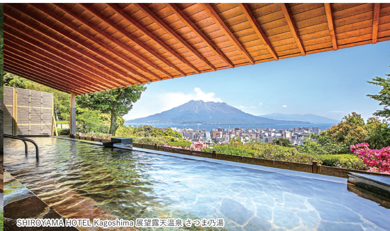
SHIROYAMA HOTEL Kagoshima 展望露天温泉 さつま乃湯