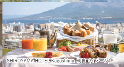
SHIROYAMA HOTEL Kagoshima 朝食 (イメージ)