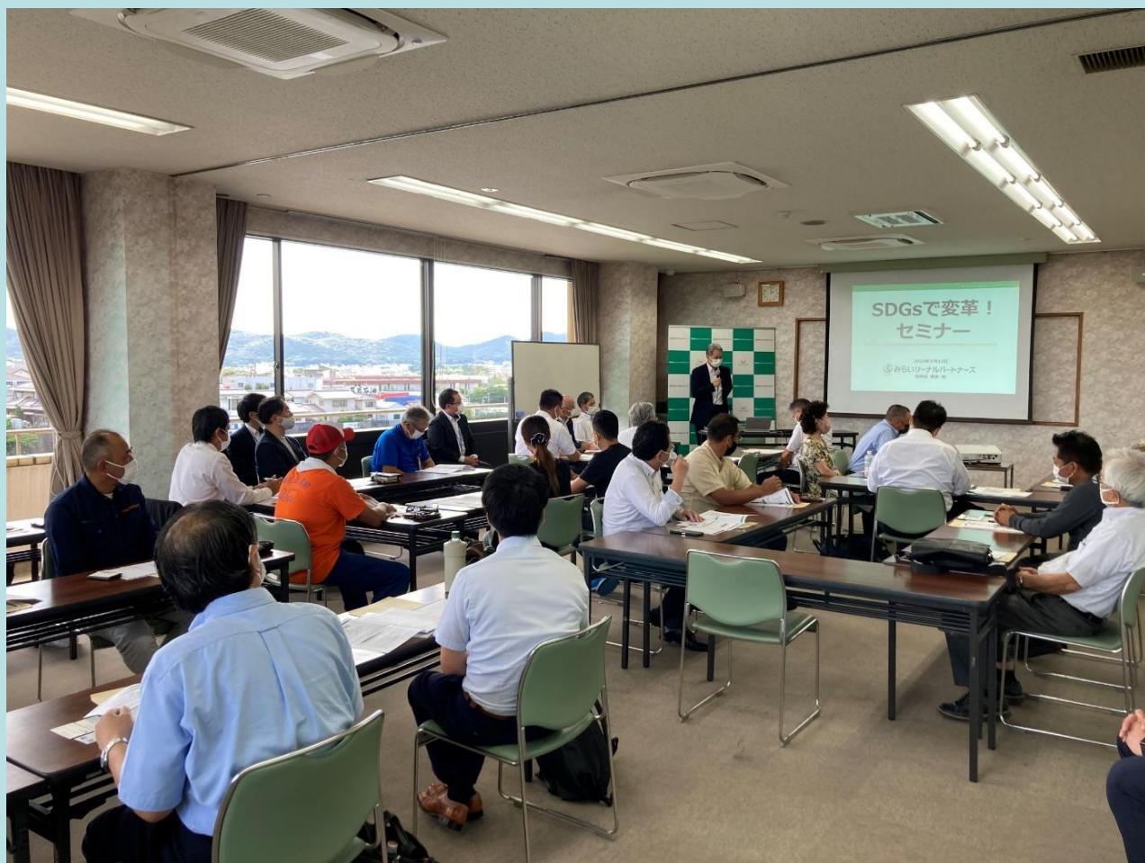
▲ 当日のセミナーの開催風景(小野商工会議所)